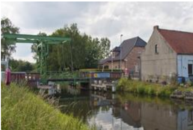
Ophaalbrug over de Moervaart

Moerbeke kende in de eerste helft van de 19e eeuw veel armoede, later kwamen enkele weverijen en brouwerijen en was er enige scheepsbouw. In de 20e eeuw verdwenen de meeste van deze bedrijven. In 2007 sloot ook de suikerfabriek.