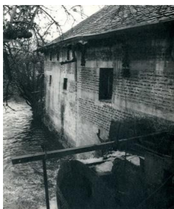
De sprietmolen uit 1742

Strombeek-Bever bleef tot 31 december 1976 een zelfstandige gemeente en maakt sinds 1 januari 1977 deel uit van de fusiegemeente Grimbergen.