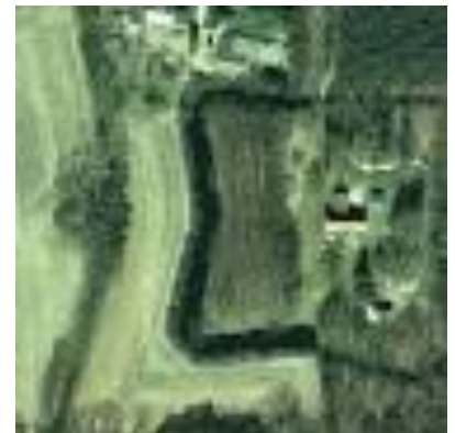
Spaans fort Francipanie