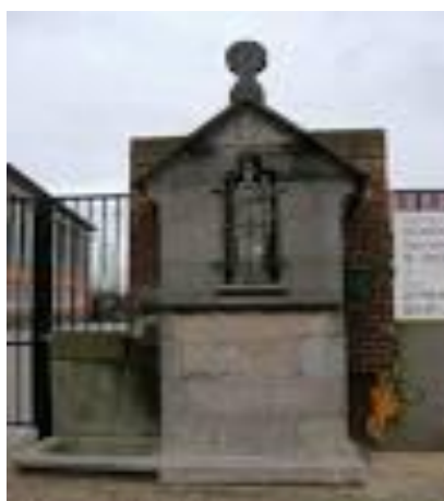
Sint-Amandskapel met geneskrachtige bron