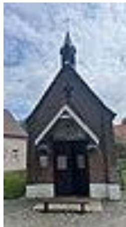
kapel O.L.Vrouw van Lourdes