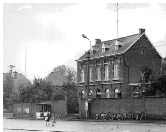
Pastorie met in de hofmuur de grafsteen van Hendrik van der Noot (1731-1827) Aanvoerder tijdens Brabantse omwenteling